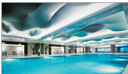
呼和浩特香格里拉酒店泳池