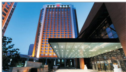
呼和浩特喜來登酒店