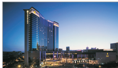
呼和浩特香格里拉酒店