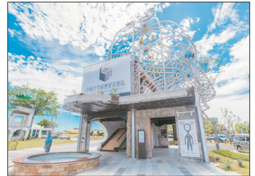
中興文化創意園區