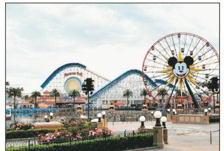
加州冒險樂園(自費)