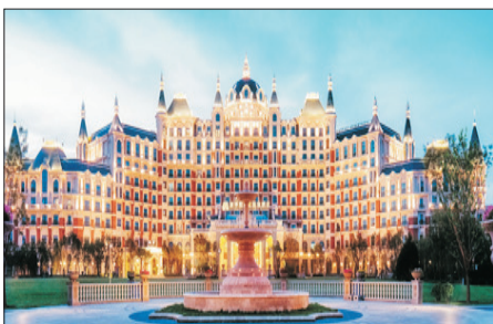
北京新華聯麗景溫泉酒店