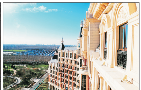
北京新華聯麗景溫泉酒店