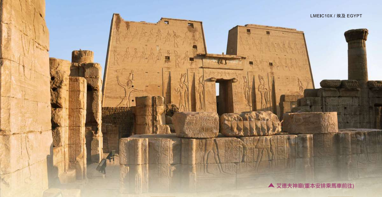
▲ 艾德夫神廟(重本安排乘馬車前往)