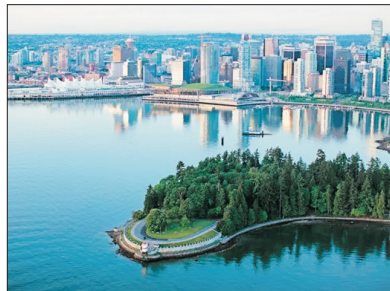
「世界最適宜居住城市之一」 溫哥華

是溫哥華最早開發的社區，鎮內既保留了復古及正宗維多利亞式風格的建築，又充滿富有現代感的商店，煤氣鎮已列入歷史城區及加拿大國家史蹟。而蒸氣鐘是鎮內最著名的景點，當年是為了蓋住蒸汽出口而興建，最有趣的是每過1小時，蒸氣鐘便會發出悅耳的音樂聲響。