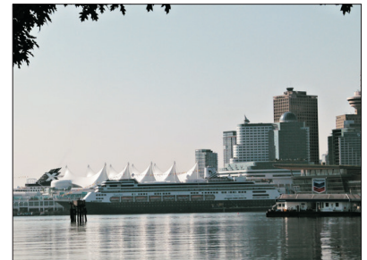
「溫哥華地標」 加拿大廣場

位於加拿大西部沿岸地區，是加拿大第三大城市。溫哥華氣候溫和，擁有多個得天獨厚、壯麗的自然美景，使它能成為享樂主義者的樂園，曾多次被聯合國及其他組織評為「世界最適宜居住城市」之一，亦是著名的旅遊度假勝地。