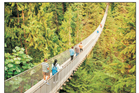
卡佩蘭奴吊橋公園