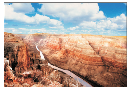
大峽谷西緣海陸空原始之旅(自費參加)