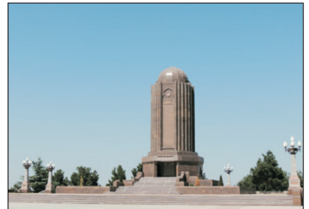
尼紮米墓及博物館