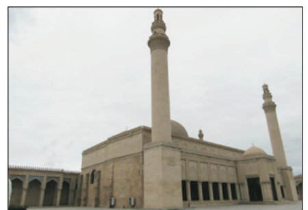
舍馬基朱馬清真寺