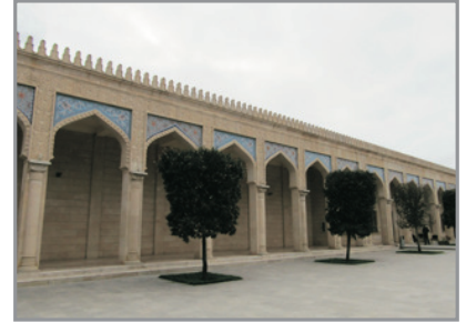
舍馬基朱馬清真寺