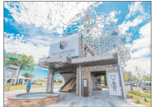
中興文化創意園區