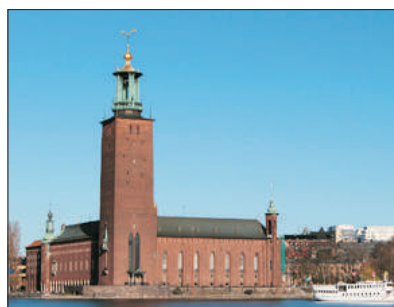
「諾貝爾獎頒獎場地」 市政廳

宮內有七個公園，二十個大小皇宮，其中一個為夏宮，宮內之廳房布置，金碧輝煌，艷麗奪目，並可看到珍貴之油畫、瓷器及家具等。夏宮前之御花園，設計別具心思。