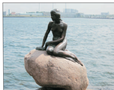
「經典童話回憶」 美人魚像

參觀每年諾貝爾獎頒獎典禮舉行地～斯德哥爾摩市政廳，安排遊覽晚宴場地～藍色大廳及典禮場地～黃金大廳。