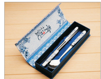
【精美紀念品】 景德鎮青花瓷餐具(每位一套)