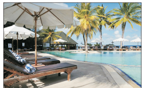
Paradise Island Resort & Spa