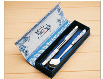
【精美紀念品】 景德鎮青花瓷餐具(每位一套)