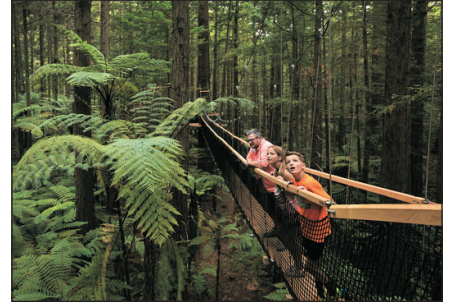
紅木樹林空中健步行