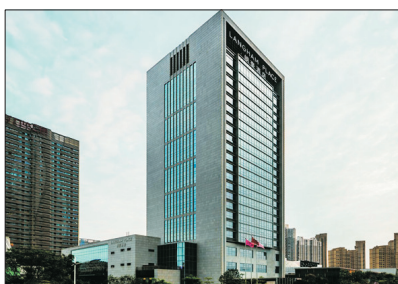
廈門朗豪酒店外觀

廈門朗豪酒店位處城中的新興商務娛樂樞紐，毗鄰城中的娛樂購物熱點萬達廣場，酒店內外裝潢雅致時尚，客房面積達42平方米以上，空間寬敞開揚。酒店更提供多元化娛樂設施包括25米的室內恆溫游泳池、「川」水療中心、健身中心等，為客人締造無與倫比的住宿享受。