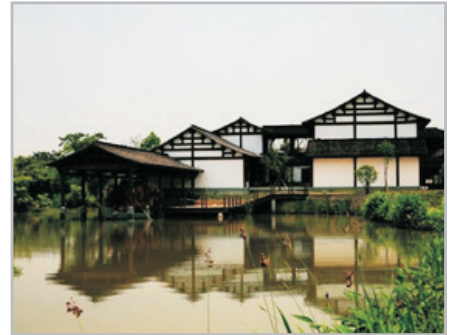
西溪國家濕地公園

~西溪濕地國家公園：被列入國際重要濕地名錄的西溪濕地國家公園，是賣座電影《非誠勿擾》的取景地。水與綠之間盡是詩情畫意，有人形容是「水在村中，村在水中」，景致特別。濕地四時景觀各異，春可踏青、夏可採菱、秋可賞蘆、冬可探梅