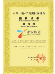
永安旅遊獨家代理 【千島湖巨網捕魚】

《獨家》千島湖(中華一絕~巨網捕魚)、黃山(北海景區、西海景區)、杭州(西溪濕地國家公園、城隍閣、白塔公園)