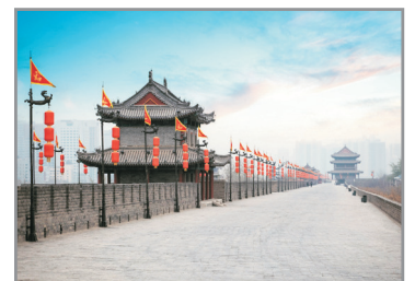
西安古城牆(回程乘坐國泰港龍航班增遊)