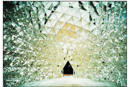
施華洛世奇水晶世界