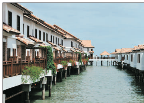
Grand Lexis Port Dickson 水中高腳屋