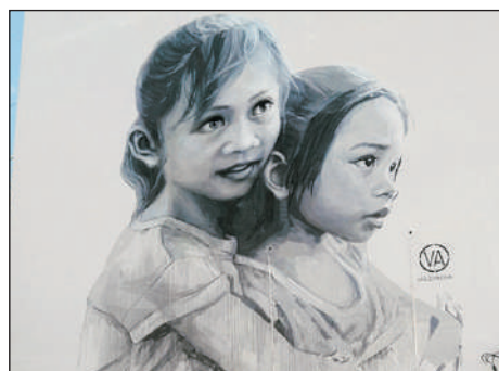
麻坡《姐妹情深》壁畫

狄臣港、麻坡文化走廊壁畫、吉隆坡皇家博物館、 馬六甲世界文化遺產馬六甲古城、三井Outlet Park、 《品嚐馬來西亞地道菜：風味海鮮鍋~肥水不流別人田、 麻坡生魚米粉、馬六甲特式葡國宴、海鮮料理等等》