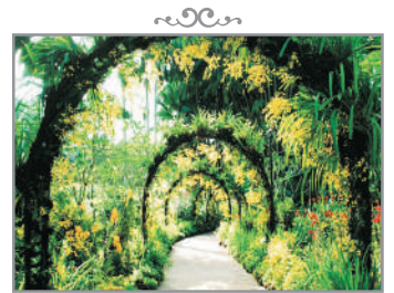
新加坡植物園 Botanic Gardens

Day 1 香港→新加坡—留住「舊時回憶」新加坡創意壁畫—小印度(途經)—亞拉伯街—【Haji Lane“型人必逛潮流個性小巷”】