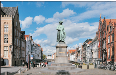
【世界文化遺產】 布魯日

比利時的古都，素有《小威尼斯》之稱。於2000年被列入世界文化遺產，曾經因水而發展，也因河道淤塞而沒落，卻因此保有它的古樸之美，是今日歐洲遊覽勝地也是近來浪漫的觀光客趨之若鶩的地方。