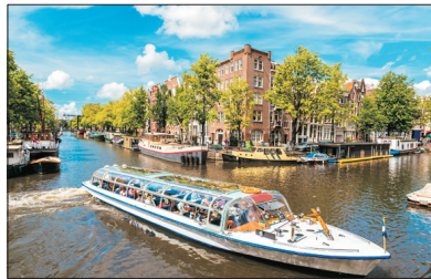
【鑽石之都】 阿姆斯特丹

比利時的古都，素有《小威尼斯》之稱。於2000年被列入世界文化遺產，曾經因水而發展，也因河道淤塞而沒落，卻因此保有它的古樸之美，是今日歐洲遊覽勝地也是近來浪漫的觀光客趨之若鶩的地方。