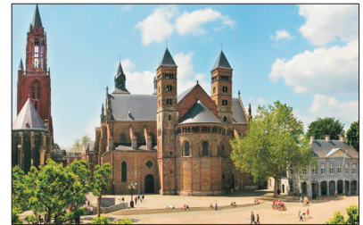
【古老城市】 馬斯垂克

是荷蘭的首都，有「北方威尼斯」及「鑽石之都」之稱。安排乘坐特色玻璃船暢遊荷蘭運河，沿途欣賞兩岸特色建築，然後到訪著名鑽石工場，欣賞鑽石鑲嵌及加工過程。