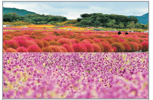
《增遊》楊州Nari公園(賞波波草及千日紅註1) (9月2日至19日出發團隊適用)