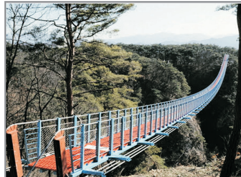
原州小金山懸索吊橋

香港→仁川—人氣綜藝節目《無限挑戰》拍攝地：原州小金山懸索吊橋(賞紅葉 註1 )—原州中央市場—美術雕刻公園