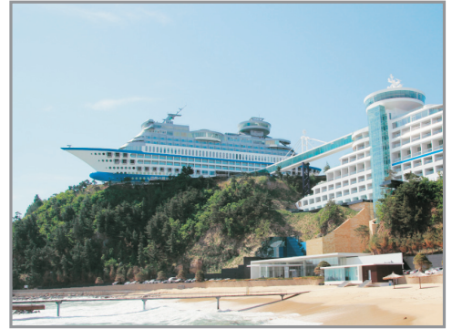
【獨家】Sun Cruise Hotel & Condo