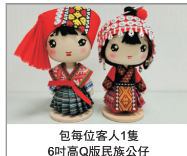
包每位客人1隻 6吋高Q版民族公仔