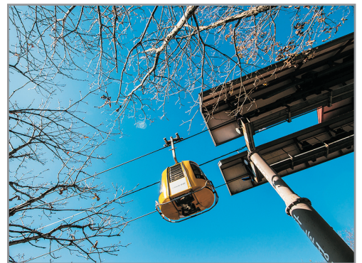
八公山道立公園(纜車體驗)