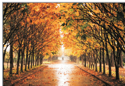
慶州森林環境研究所散步路