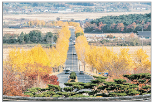
《增遊》統一殿(賞銀杏註1) (10月25日至11月10日出發團隊適用)