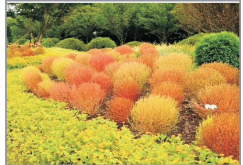
上孝園樹木園(賞掃帚波波草註1)