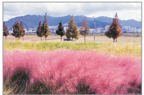
《增遊》大渚生態公園(賞粉紅亂子草註1) (10月1日至25日出發團隊適用)