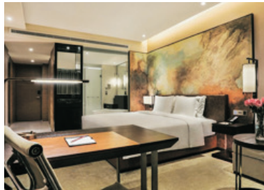
成都溫江皇冠假日酒店

雅居樂豪生大酒店(由國際品牌溫德姆集團管理，酒店設計展現精緻優雅的地中海式風格，房間面積為65平方米，每房均設獨立露台及小客廳)