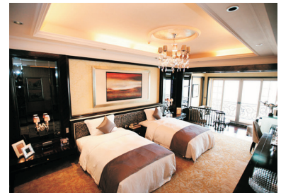
成都雅居樂豪生大酒店 (每房均設獨立露台及小客廳)