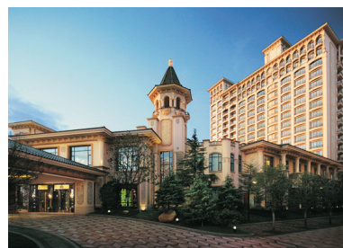
成都雅居樂豪生大酒店