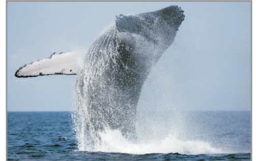
世界最大哺乳類動物(藍鯨)