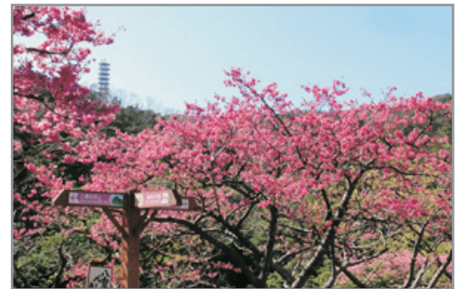
季節限定：八重岳櫻花 增遊八重岳~觀賞全日本最早櫻花 (2019年1月24日至2月3日出發適用)(註7)