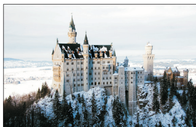
「童話世界的靈感來源」 新天鵝堡

乘坐登山火車或纜車登上德國最高約一萬尺高之楚格峰，更可於觀景台飽覽及拍攝一望無際的雪山境。