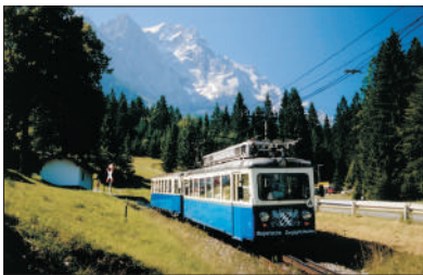
「高峰美景」 楚格峰大雪山

乘坐登山火車或纜車登上全德國最高約一萬尺高之楚格峰，更可於觀景台飽覽一望無際雪山景。