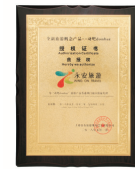
永安獨家總代理 【上海動吧】