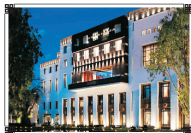
拉薩瑞吉度假酒店