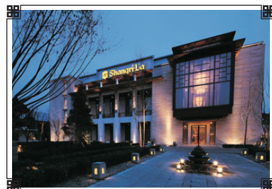
拉薩香格里拉大酒店