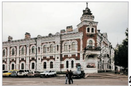
阿穆爾地方誌博物館