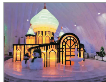
哈爾濱冰雪大世界

▲哈爾濱至長春路段或會改用和諧號前往；長春至長春機場則乘坐旅遊巴前往，一切以接待安排為準。