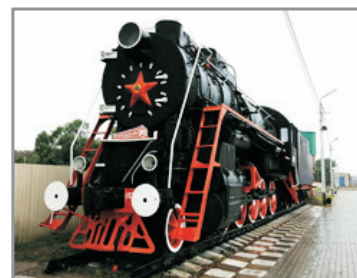
布拉戈維申斯克火車站