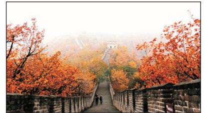
慕田峪長城【賞紅葉】