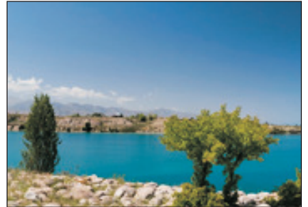
伊塞克湖(吉爾吉斯)