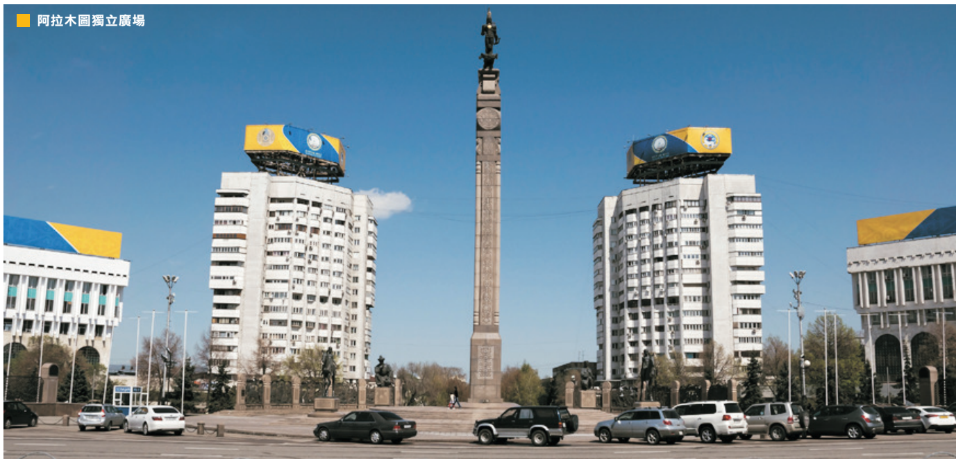
■ 阿拉木圖獨立廣場

面積272.49萬平方公里。為地處中亞的內陸國，並地跨歐亞兩洲，西瀕裏海，東南連接中國，北鄰俄羅斯，南與烏茲別克、土庫曼和吉爾吉斯斯坦接壤。多為平原和低地。西部最低點是卡臘古耶盆地，低於海平面132米；東部和東南部為阿爾泰山和天山；平原主要分佈在西部、北部和西南部；中部是哈薩克丘陵。荒漠和半荒漠佔領土面積的60%。湖泊眾多，約有4.8萬個，其中較大的有裏海、鹹海、巴爾喀什湖和齋桑泊等。冰川多達1500條，面積為2070平方公里。