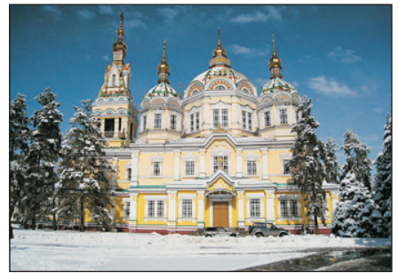
東正教升天大教堂