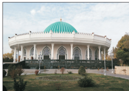
帖木兒歷史博物館