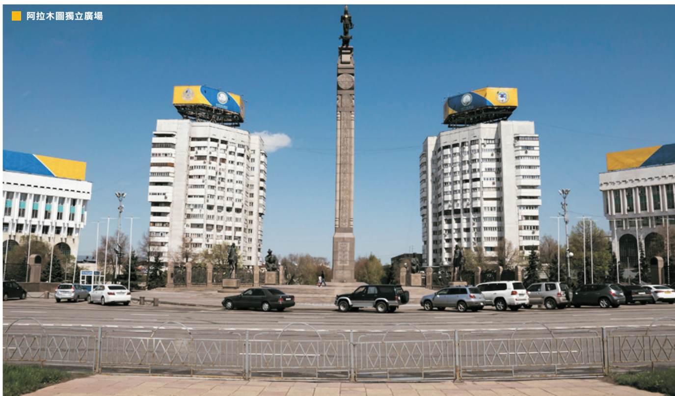
■ 阿拉木圖獨立廣場

面積272.49萬平方公里。為地處中亞的內陸國，並地跨歐亞兩洲，西瀕裏海，東南連接中國，北鄰俄羅斯，南與烏茲別克、土庫曼和吉爾吉斯斯坦接壤。多為平原和低地。西部最低點是卡臘古耶盆地，低於海平面132米；東部和東南部為阿爾泰山和天山；平原主要分佈在西部、北部和西南部；中部是哈薩克丘陵。荒漠和半荒漠佔領土面積的60%。湖泊眾多，約有4.8萬個，其中較大的有裏海、鹹海、巴爾喀什湖和齋桑泊等。冰川多達1500條，面積為2070平方公里。