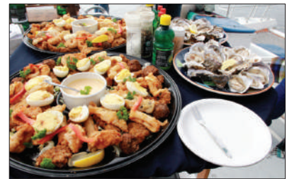
「美食饗宴」 納米比亞

埃托沙國家公園，曾是地球上最大的野生動物保護區，可觀非洲五大動物!是觀賞野生動物的絕佳去處，還有十億年前形成的巨大鹽沼，更是自然界的奇觀。(9天團適用)