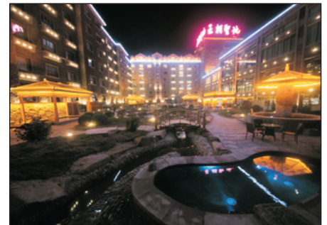
王朝聖地溫泉度假酒店

座落於長白山池北區，酒店大堂左右兩側建有祥雲柱，以長白山特有的玄武岩雕琢而成，刻有祥雲圖案，設計氣派非凡。酒店佔地6000多平方米，酒店附設有內外共39個溫泉泡池以及恆溫游泳池、SPA養生中心等。(客人可自費浸泡溫泉，開放與否需視乎當天酒店公佈為準。)