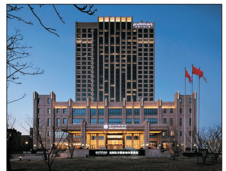
瀋陽東方銀座鉑爾曼酒店