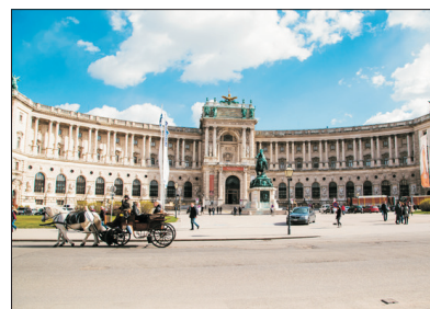
「維也納兒童合唱團之表演場地」 荷夫堡

是欣賞布達佩斯和多瑙河最佳地點，觀賞對岸的國會大廈，和多瑙河上的點點船隻與細長橋影。夏季觀光季節時，漁人堡前會聚集許多街頭藝人表演民俗音樂或舞蹈，更添熱鬧。