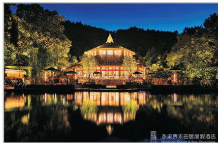
五味坊餐廳+戶外泳池夜景