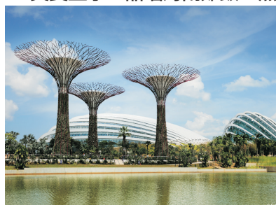
Gardens by the Bay(新加坡)