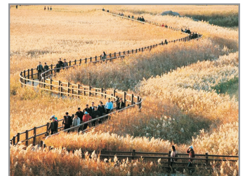
全羅南道·順天灣濕地

永安旅遊專線：2928 8882 wingontravel.com 牌照號碼：350074