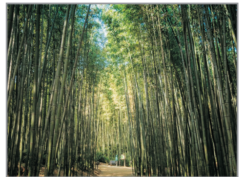
全羅南道·潭陽竹綠苑

大屯山位於忠清南道及全羅北道交界, 奇岩、怪石、溪谷、瀑布等構成的絕佳美景, 尤以秋楓景致最為吸引。抵達山頂後, 可跨越高81米的「金剛排雲橋」。站在橋上, 被美麗的大自然所深深地陶醉, 令人忘掉懸橋之險。