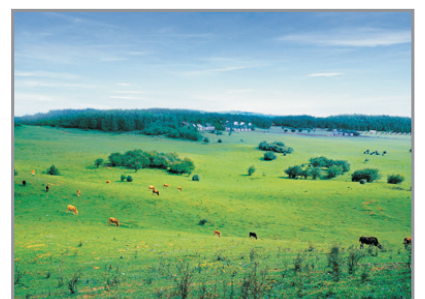
仙女山國家森林公園