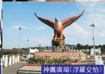
神鷹廣場(浮羅交怡)