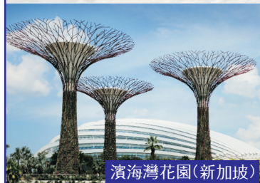
濱海灣花園(新加坡)