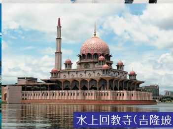
水上回教寺(吉隆坡)