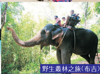
野生叢林之旅(布吉)