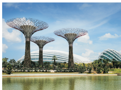
Gardens by the Bay(新加坡)