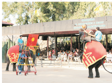
東芭樂園植物園(泰國)