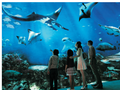
S.E.A海洋館(包入場)(新加坡)