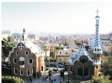
奎爾公園(巴塞隆那)