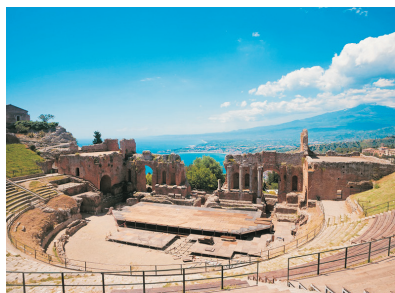
陶米納山城(西西里島)