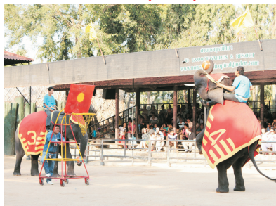
東芭樂園植物園(泰國)