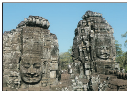
吳哥窟遺跡~ 四面巴戎佛